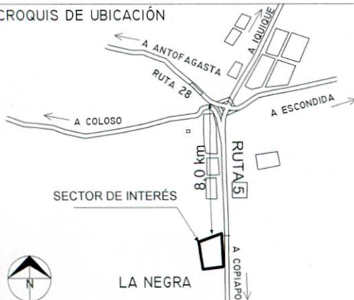
CROQUIS DE UBICACIÓN