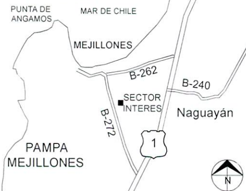
CROQUIS DE UBICACION